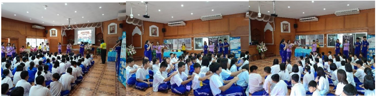
๒๐. โครงการควบคุมหนองพยาธิของสมเด็จพระเทพรัตนราชสุดาฯ สยามบรมราชกุมารี (โครงการตามพระราชดำริด้านสาธารณสุข)