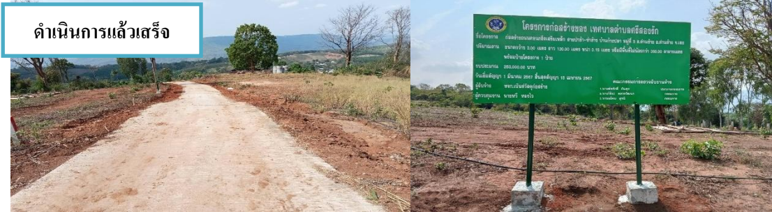
ดำเนนงำนแล้วสร่ง