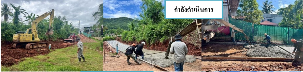
กำลังดำเนินการ