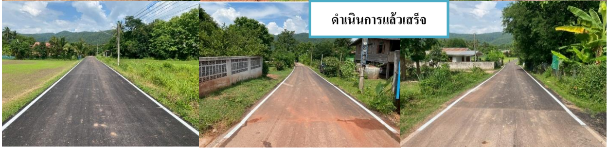
ดำเนนงำนแล้วสร่ง