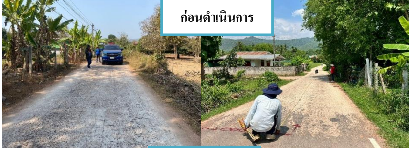
ก่อนดำเนนงำน