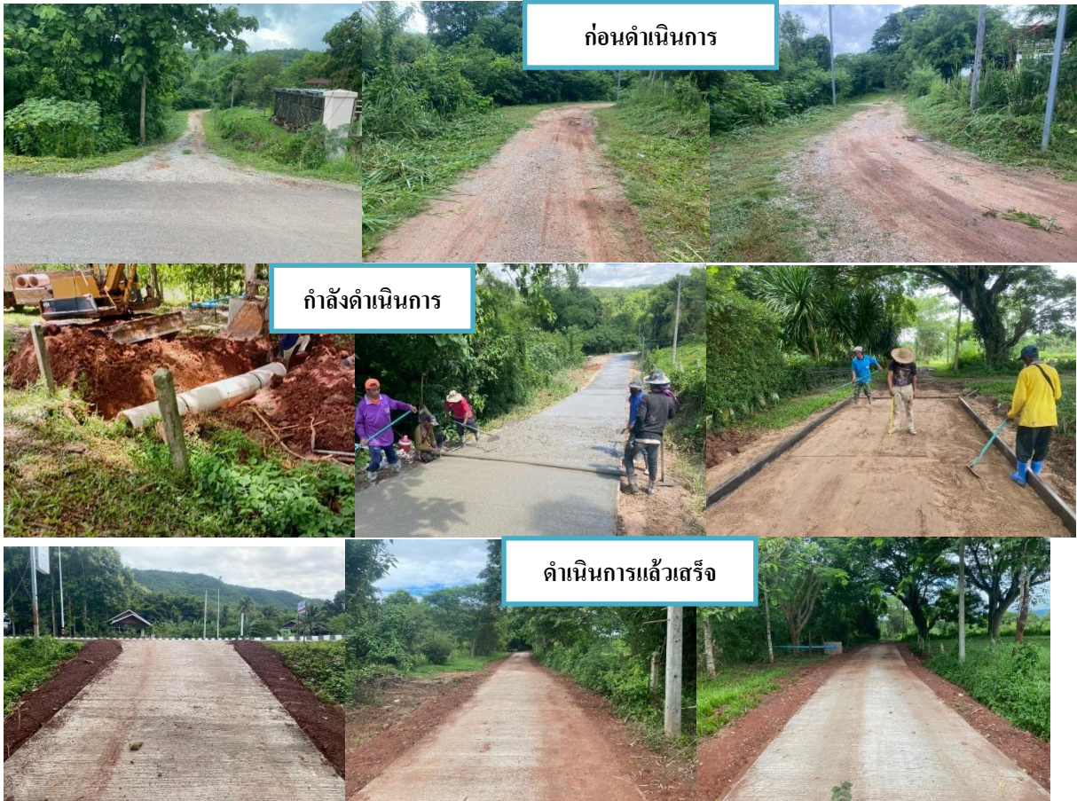
๑๒. โครงการก่อสร้างถนนคอนกรีตเสริมเหล็กเพื่อการเกษตร สายโตกป่าไซ บ้านหมามแห่ง หมู่ที่ ๗