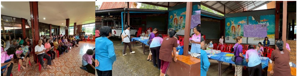
๒๑. โครงการอบรมหม่อมหมู่บ้านในพระราชประสงค์ ประจำปีงบประมาณ พ.ศ.๒๕๖๘