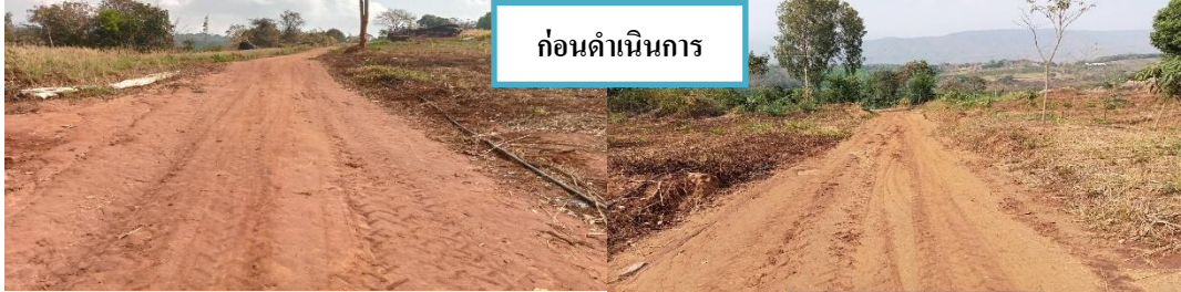
ก่อนดำเนนงำน