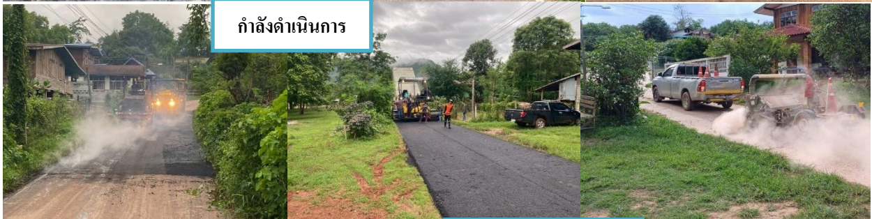
กำล่งดำเนนงำน