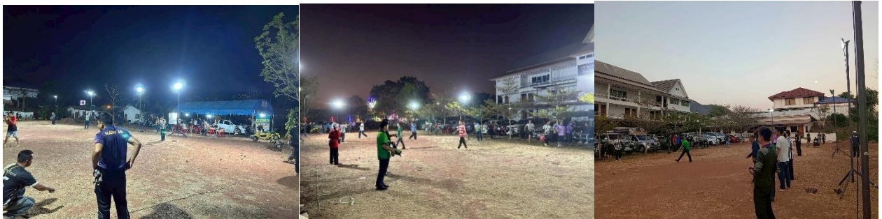
๓๕. โครงการมหาดไทยสีขาวสร้างพื้นที่ปลอดภัย หยุดยั้งยาเสพติด (Safe Zone No Drugs)