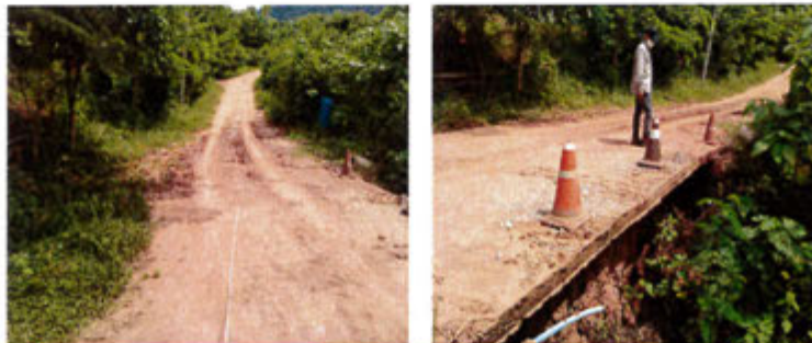
กำลังดำเนินการ