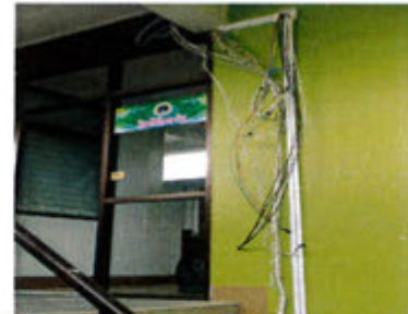
ดำเนินการแล้ว