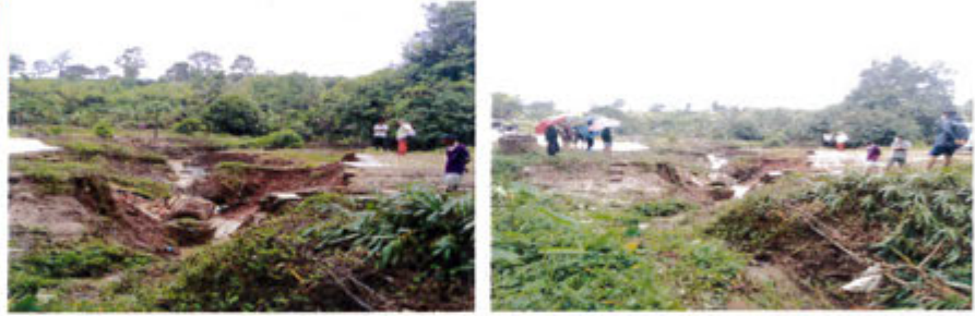
กำลังดำเนินการ