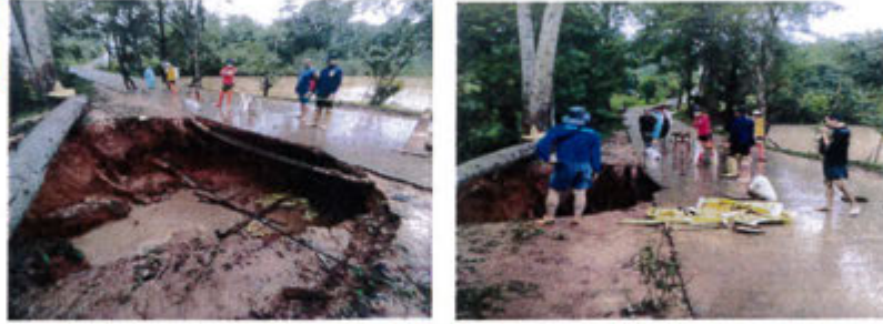
กำลังดำเนินการ