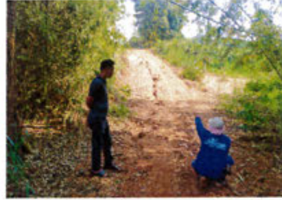
กำลังดำเนินการ