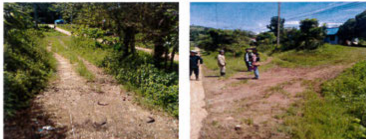
กำลังดำเนินการ