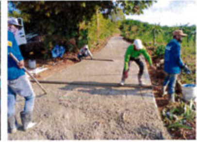
ดำเนินการแล้ว