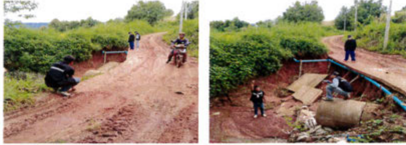
กำลังดำเนินการ