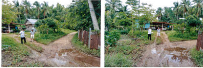
กำลังดำเนินการ