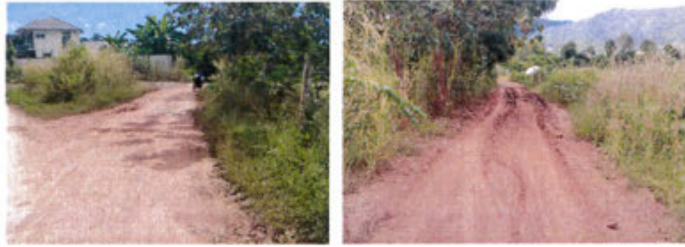
กำลังดำเนินการ