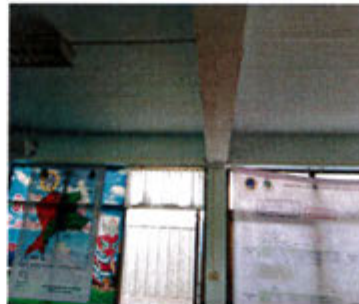
กำลังดำเนินการ