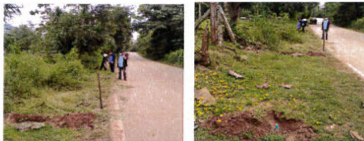
กำลังดำเนินการ